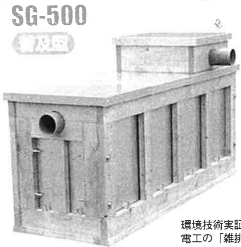
環境技術実証事業に選定された正和 電工の「雑排水専用新浄化装置」

最高賞の協会会長賞が贈 られた。 同社の開発製品は、平 成16年に世に送り出し、 全国的なヒット商品とな った「大根洗浄機」をト ップランナーに各種野菜 の洗浄機、選果施設、破 砕機など、すでに10数の アイテムを数えているが、 特に「皮剥き機」につ いては、「ブラッシを回し ながら、あくまでも水圧 で皮を剥くという、従来 にはなかった発想の開発」 という点が高く評価され たという。 「わが社は大企業によ うな立派な開発部門を持 つわけではなく、お客さ