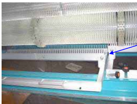
ブラシクリーナー

新機種では、ブラシの配列を千鳥タイプから平行タイプにし、 ブラシクリーナー を標準装備しておりますので、 髭を絡みにくく 且つ清掃も簡単になりました。 ブラシクリーナー の取り外しも簡単に行えます。