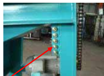
グリースニップル

グリースニップルは脚に集中させておりますのでカバーをはずすことなく簡単にグリース補給が行えます。