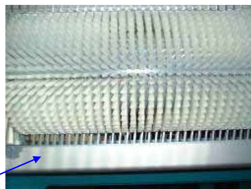
新機種 洗浄機ブラシ

縦送洗浄タイプで耐磨耗細毛ブラシにより、原料が1本づつ回転しながら送られ、先端、曲がり、凹部などの汚れをリングブラシにより浮かせ、高圧扇状型ノズルによって洗浄されます。