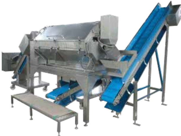
オプションの供給・排出側コンベアーを設置