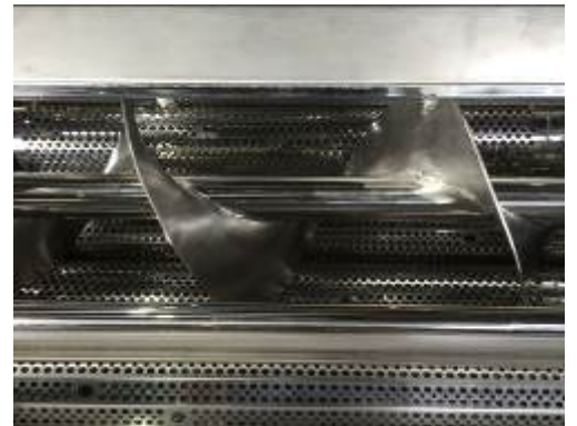
スクリーン搬送方式

また、 スクリーン搬送方式 により、大量で安定した皮剥きが実現し、更には オープンフレーム構造 と クリーニングモード制御 により日常の清掃 メンテナンスが容易 になりました。