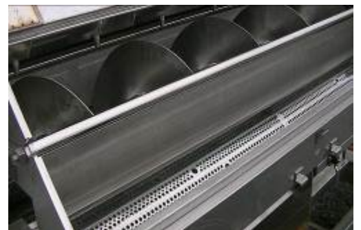
オープンフレーム構造