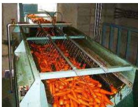
洗浄前に葉屑を取り除きます

人参の送りはブラシの回転速度で調整することが可能で、任意に調節できるようにインバーター制御を設けております。またインバーター制御することにより、クッションスタート機能もございますので、機械の起動時の衝撃がなく、軸受けやその他部品の消耗も軽減されます。