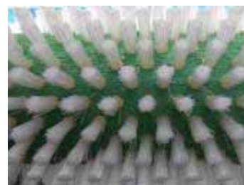
ブラシの斜植毛状況

ブラシの回転速度もインバーターにより変えられ、また出口部では出口開閉部にウェイトを用い、洗浄機からの排出量の調節(洗浄状態の調整)が簡単に行えます。